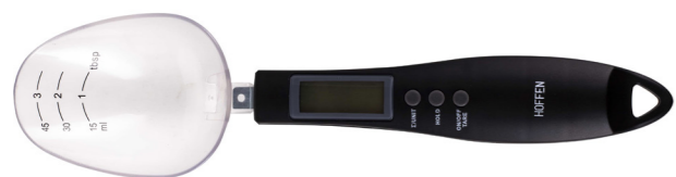
SPoon SCALE SPOON SS-0534

(This instruction manual covers various colour versions of the device)