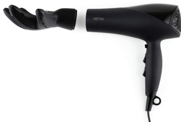
Diffuser - correct installation