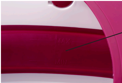
Minimum and maximum water level

Warning! Never exceed the maximum water level.